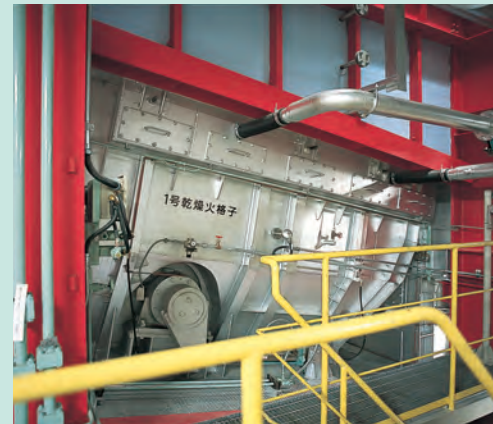
焼却炉 階段状に火格子が設備され、ごみを燃焼させます。 Incinerator: Incinerates the waste. The combustion grate is arranged in a stair-like pattern.