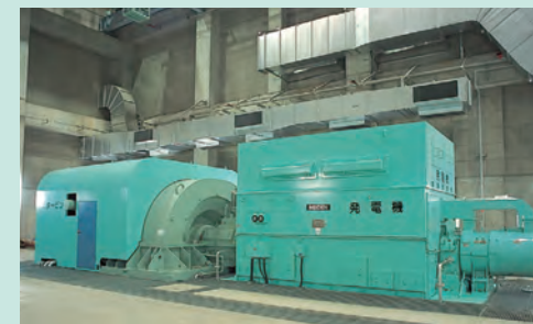
蒸気タービン発電機 ボイラで発生した蒸気により発電します。 出力27,400kW Steam turbine generator: Steam from on-site boilers powers this steam turbine generator to an output of 27,400 kW.