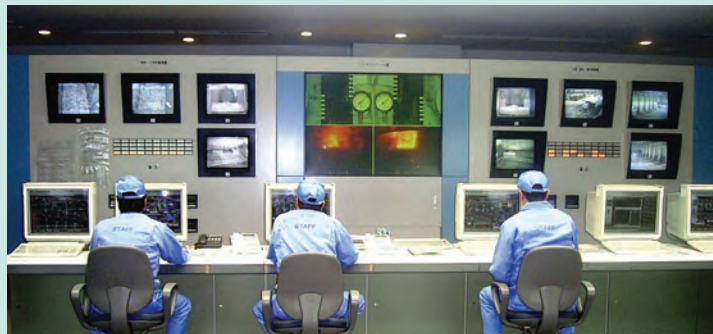
中央制御室 工場全体の状態を常に監視し、集中制御します。 Central control room: The entire plant is monitored and controlled from a central control room.