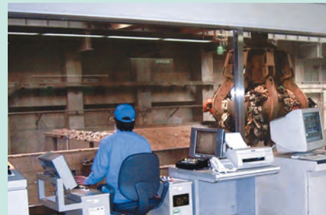
ごみクレーン操作室 ごみクレーンを操作します。 Waste crane control room: The waste crane is operated from the crane control room full automatically or manually.