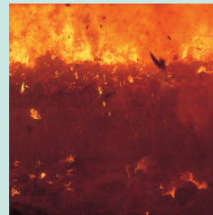
焼却炉内 約850℃～950℃の高温焼却により、ダイオキシン類の発生を抑え、悪臭を分解します。

Inside the incinerator: Temperatures inside the incinerator reach 850°C to 950°C in order to prevent generation of dioxins and break down odor components.