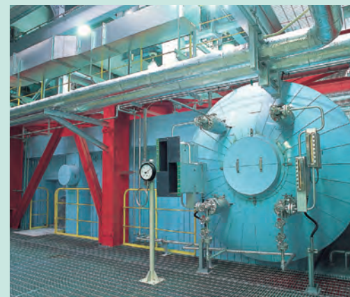
ボイラ 焼却熱を利用し、蒸気を発生させます。 Boiler: Uses garbage heat to generate steam.