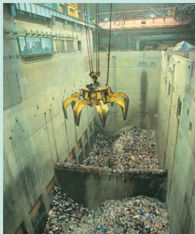
ごみピット・ごみクレーン ごみピット容量約15,000m 3 、ごみクレーンつかみ量約12t Waste pit and crane: A 12 ton crane grabs waste from a 15,000 m 3 pit.