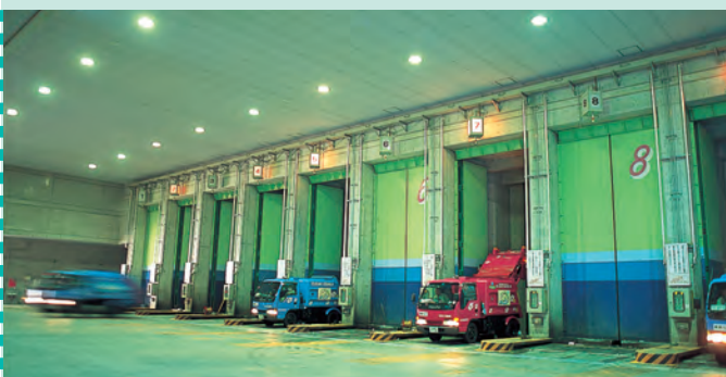
プラットフォーム 収集したごみは、11面の投入扉からごみピットに投入されます。 Platform: Collected waste is fed to the waste pit through 11 doors.

Inside the incinerator: Temperatures inside the incinerator reach 850°C to 950°C in order to prevent generation of dioxins and break down odor components.